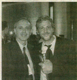
Urbesni žaca - komičar Patrik Uard

Ovom delu je ujedno pripala i nagrada "Zlatna rolna" ("Golden Reel Award") za najgledaniji kanadski film u 2006., sa prihodom od 12,5 miliona dolara, što ga je ujedno učinilo i ovdašnjim najkomercijalnijim celuloidnim ostvarenjem svih vremena. "Dobar žaca,