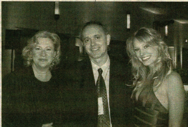
Slovenski šarm - Predsednica kanadske Akademije za film i tv Marija Topalović sa kćerkom Katarinom

frankofon iz Kvebeka, bučan i naprasis, koji kroji zakone prema svojoj meri. Njih dvojica su čudan tandem, kao led i vatra, prisiljeni da rade zajedno ali upravo te različitosti između njih im pomažu da zajedno reše misteriju zločina na granici između Ontarija i Kvebeka.